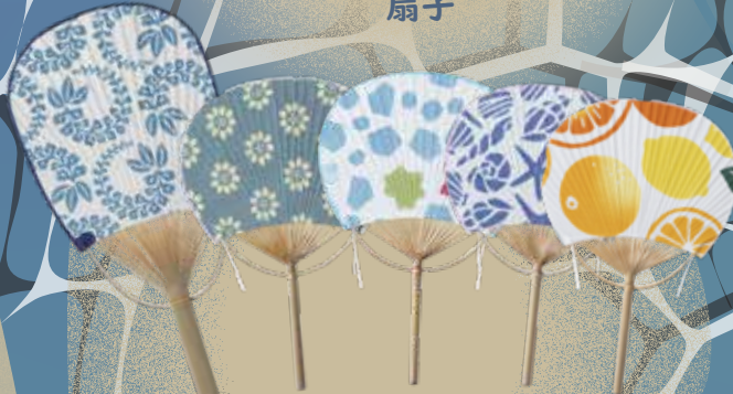
ミュージアムショップ SL 東京駅売店 団扇 各種