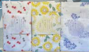
和雑貨 楽 手ぬぐいタオル