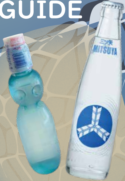
駄菓子屋 ハ雲 ラムネ