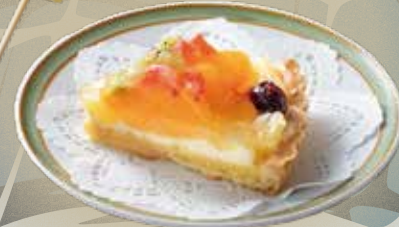
帝国ホテル喫茶室 🍷 フルーツタルト