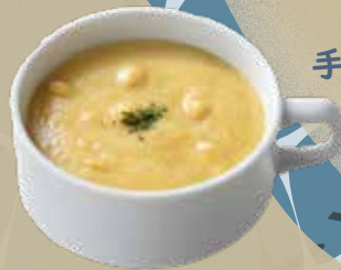
明治の洋食屋 オムライス&グリル 浪漫亭 🍷 冷製コーンポタージュ