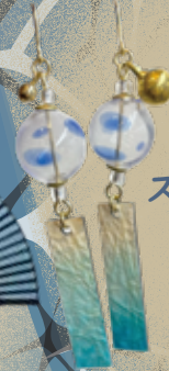
和雑貨 楽 SL 東京駅売店 スケフウリンピアス (イヤリングもあります)