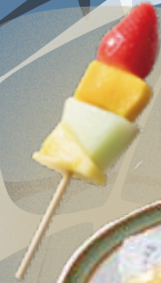
「食道楽のカレーばん」の店 🍷 フルーツバー