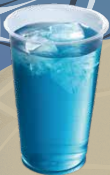
食道楽のカフェ 🍷 ブルーレモネード