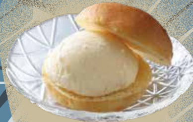
メイジ珈琲時館 🍷 ジェラートツツオ