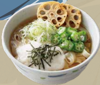
めん処 なごや庵 🍷 スタミナきしめん