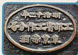
側面に取り付けられている 銘板「明治12年工部省工作 分局東京赤羽」

この平削盤の横梁に取り付けられている三つの菊の紋章は、明治政府によって作られた機械であるというを示しています。銘板に記されている「工部省工作分局」は明治政府工部省の直轄工場で、殖産興業政策を推進するために設けられた工場です。この機械自体は岩手県の船舶修理工場向けに出荷されたもので、後に工場は岩手県立盛岡工業高校に引き継がれ、実習用として大切に使用されてきました。 昭和44年、博物館明治村の鉄道寮新橋工場の移築竣工にあたり開催された「機械館展」に出品され、引き続き寄託資料として展示され今日に至っています。 今回、この平削盤は日本の機械工業の初期の実情を伝える工作機械として歴史的に貴重であることから重要文化財の指定を受けました。