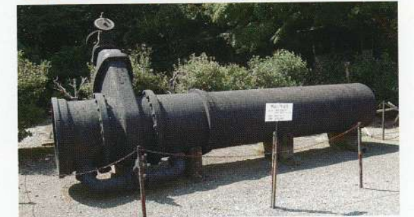
写真1 機械館の北側に展示されている明治時代の水道管

南北に伸びる明治村の中ほど、四丁目四十四番地には鉄道寮新橋工場が移築されています。明治時代の産業、工作機械等を集め、昭和四十四（一九六九）年、明治村の開村四周年目に機械館として公開されました。今回の主役はその機械館の北側に展示されている、明治時代の水道管です（写真1）。