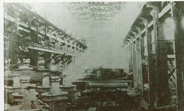
写真4 釜石製鉄所内の鉄管の鑄造所 （『明治工業史 鉄鋼篇』より転載）