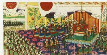
表紙錦絵／ 憲法発布式之図 長谷川竹葉画 明治22(1889)年