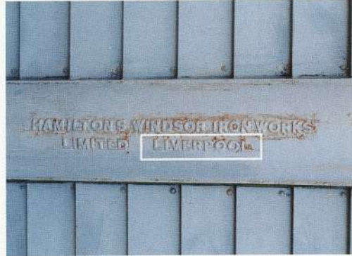
写真5 鉄道寮新橋工場の鉄製柱