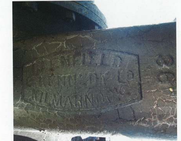
写真3 仕切弁に記された製造会社の刻印 （製造会社の刻印は見学可能箇所からはご覧いただけません。）

名古屋市では、明治四十二年（一九〇九）年に上水道の敷設に着工し、大正三（一九一四）年に完成します。これにより、名古屋市の上水道は愛知県大山市を流れる木曾川から取水し、名古屋千種区にある鍋屋上野浄水場を経て各家庭に配水されるという仕組みが整います。その後改修や増築を重ねながら、百年近くを経た現在も名古屋市民の生活を支えています。 明治村に展示されている水道管は、上水道敷設工事中の明治四十五（一九一二年）、現在の名古屋守山区庄内川の川底に埋設されたものです。長さ約三・六メートル、口径約九センチ、重さ二トンの鑄鉄製直管に、重さ約四・五トンの仕切り弁が取り付けられています。昭和五十九（一九八四）年の三月、水道管の新設交換を機に明治村へ寄贈されました。 ではこの水道管は、いつ、どこで製造されたのでしょうか。水道管にはそれがわかる刻印が残されています。直管と仕切弁双方に名古屋市の市章「A」と「明治四十四年」という刻印があり（写真2）、明治四十四（一九一一年）年に製造され、名古屋で使われていたことが分かります。