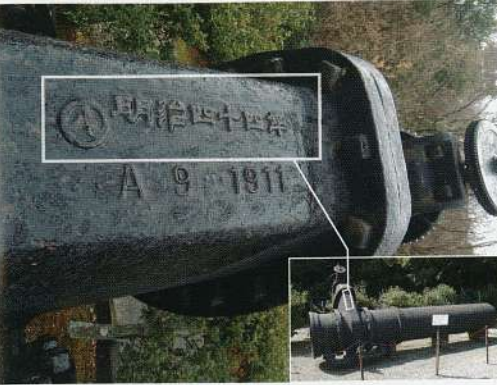
写真2 仕切弁に記された製造年の刻印

南北に伸びる明治村の中ほど、四丁目四十四番地には鉄道寮新橋工場が移築されています。明治時代の産業、工作機械等を集め、昭和四十四（一九六九）年、明治村の開村四周年目に機械館として公開されました。今回の主役はその機械館の北側に展示されている、明治時代の水道管です（写真1）。