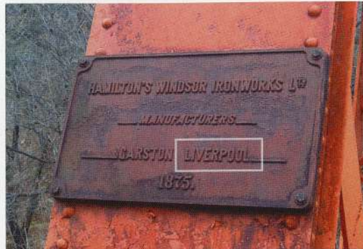
写真6 六郷川鉄橋の銘板

明治政府は、日本を西洋の列強国と肩を並べられるような強く豊かな国にするべく、イギリスをはじめ諸外国から知識や技術を積極的に導入しました。特に明治時代初期における鉄や、鉄を加工する技術については、当時世界を代表する工業国となっていたイギリスから多大な影響を受けていました。水道管の隣にある鉄道寮新橋工場の鉄製柱（写真5）、その向かいに架けられた六郷川鉄橋（写真6）はいずれも明治初期に建設された、イギリス製の鑄鉄を利用した建造物であることが「LIVERPOOL」という刻印からわかります。 以上を踏まえると、この水道管は日本の近代化に大きく寄与したイギリスの仕切弁と、国産の直管とが組み合わさった、明治時代の工業の進展を知ることが出来る貴重な産業遺産といえます。昨今、グローバル化に伴う、国際理解が教育の中で重要視されています。この水道管は、諸外国との積極的な交流は今に始まったことではなく、むしろ、百年以上も昔の明治時代においてすでに、様々な側面で国際化が進展していたことを、私たちに伝えてくれています。