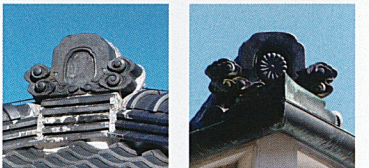
写真4 名古屋衛成病院の鬼瓦 写真5 歩兵第六聯隊兵舎の鬼瓦 菊の紋が表されている

別称「唐草」というくらい飛鳥時代から多種多様な唐草文様が使われてきました。ちなみに「垂れ」に模様があると、軒先に流れてくる水を切る役目もあり、瓦の裏側まで水が流れず下に落ちるようになります。また、「小巴」にはその名前の通り巴文が描かれています(写真3)。巴文は12世紀中頃、渦巻く水をかたどった文様と理解されるようになり、防火への願いから瓦の文様にも登場し普及するようになります。