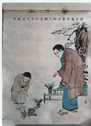
写真4 修身学習用の掛図 明治二十六年発行「実録日本修身書入門掛図」より

た日常生活に必要な知識を、先生から個 別に教えるというものが主な形式 でした。一方、明治政府が目指した教育で は、一人の教師が複数人の生徒を対象に 一斉授業を行ない、具体的な事物やその 絵などを使って、「問答」と呼ばれる教師と の対話を通して理解を深めようとする、 「実物教授」、あるいは「庶物指教」と呼ばれ る、アメリカで行なわれていた授業形式 でした。当時の小学校教師向けの授業指 南書にある授業例を見ると、「筆」について 教える際には、教師は筆の絵を指し、筆は 何に使うものなのか、どんな材料ででき ているのか、どこで使われるものなのか、 といった質問を生徒に問います。問われ た生徒が質問に答えると、教師はその答 えを板書して、最後は全員でその答えを 読み上げる、といったものだったよう です。掛図はこうした形式の授業において、 非常に効果的な教材として活用されま した(写真3)。そのため、動物や道具、色と