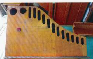
写真5 明治村所蔵オルガンの内部に組み込まれたQualifying Tube

C&W社のオルガンの特徴を、広告やオルガンコレクターのフルーク(Fluke, P.)はその著書の中に、品質のよいパイプオルガンと同等の音色を出すことができるQualifying Tube(写真5)なる装置を備えていることを挙げています。