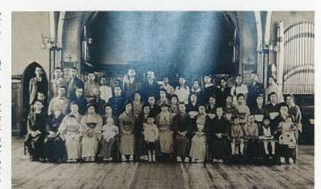
写真7 聖ヨハネ教会所蔵古写真

です。一方、修理は着実に進捗しており、秋に皆さまにオルガンの音色をご披露できる予定です。その際には、音色とともにオルガンに込められたストーリーをご紹介できるような調査を進めてまいります。 *** 文献調査にあたり、エリザベト音楽大学図書館の皆さまに格別のご高配をいただき、多くの資料を集めることができました。 また、これまで手がけることができなかったオルガン修理に着手できたのも、クラウドファンディングを通じて、多くの方にご支援いただいたお陰です。ご支援いただいた皆様に謝してお礼申し上げます。