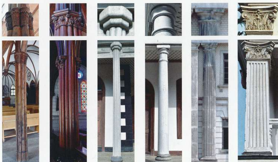
写真6 大明寺 聖パウロ教会堂 写真5 聖ザビエル天主堂 写真4 東山梨郡役所 写真3 三重県庁舎 写真2 内閣文庫 写真1 大井牛肉店

頭をもちます。ドリス式は他の オーダーとは違い、エンタプレ チュアを構成する水平部分に、 縦に溝が入ったトリグリフと、 メトープと呼ばれる小壁 が交互に配されます。 内閣文庫は、貴重な書籍など を所蔵する明治政府の中央図書 館として、建物の威厳や堅牢さ を表現するべく古代ギリシア・ ローマの神殿建築を思わせるル ネサンス様式を採用し、ローマ・ ドリス式のオーダーを用いたと 考えられます。 明治村ではこの他にも、建物 の内外に、ここで紹介したギリ シア・ローマのオーダーを模し たものなど、多彩な柱を見るこ とができます。 日本人工大工たちの手によって 建てられた擬洋風建築注1であ る三重県庁舎(写真3)と東山梨郡 役所(写真4)には、オーダーを模 した柱頭装飾や束ね柱が見られ ます。また、外国人神父の監督・ 指導のもとで日本人が建てた、 聖ザビエル天主堂(写真5)と大 明寺聖パウロ教会堂(写真6)ではゴシック 様式建築の一つの特徴である束ね柱(注2) や、柱頭にはアカンサス、月桂樹、葡萄など の彫刻が見られます。