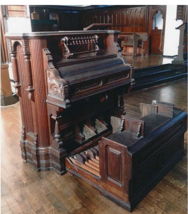
写真1 聖ヨハネ教会堂に展示されているリードオルガン