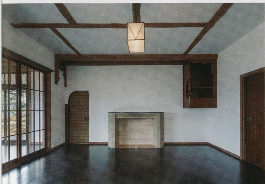
モネの絵が飾られていた洋間