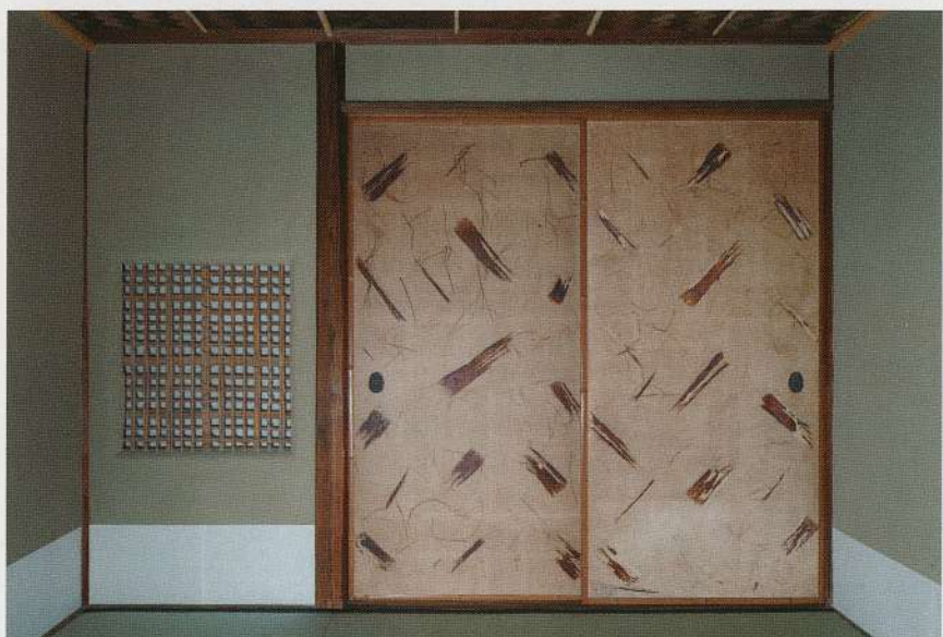
修理された杉皮がすぎこまれた襖

□箱ノ材ハ東京神田駿河台西園寺公爵邸内ニ立チシ樟樹ニシテ大正十二年九月一日ノ大震災災ニ遭ヒテ焼残セル部分ヨリ取ル