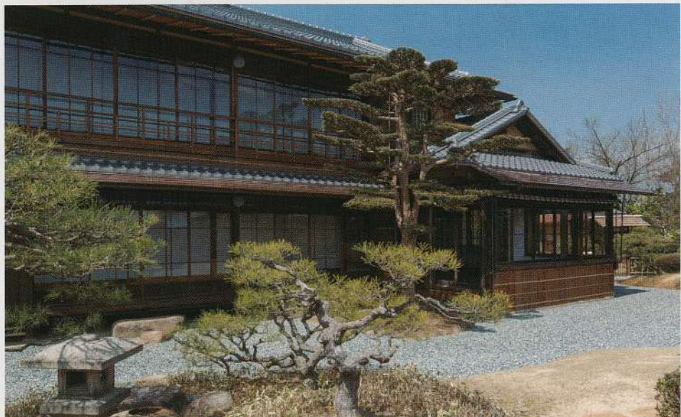
庭から建物を望む