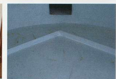
化学教室の黒板裏側に設けられたドラフトチャンバー ドラフトチャンバー内の煙道

このたび、博物館明治村に移築されている第四高等学校物理化学教室が、「明治政府が中等・高等教育において実験を含めた自然科学教育を極めて重要視していたことがうかがえる貴重な史料である。」として化学遺産認定されました。認定式は3月28日に名古屋大学で開催され、化学遺産認定証が授与されました。