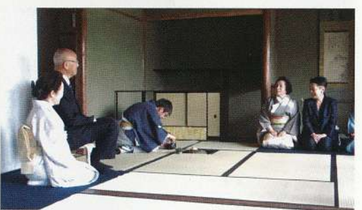
明治村茶会の様子