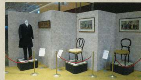
会場エントランスでの展示風景