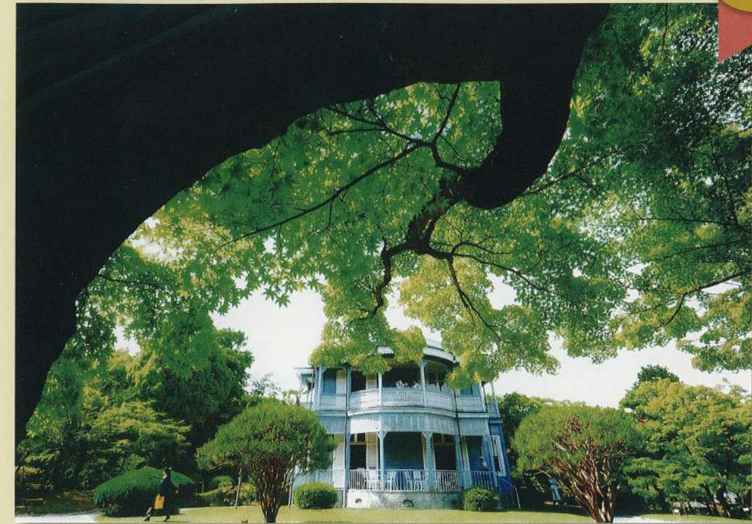
「若楓と西洋館」 加藤 静夫