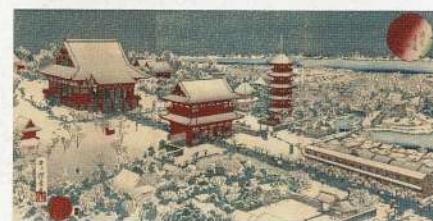
表紙錦絵 雪月花之内雪浅草鏡山之図 井上探景画 明治18 (1885) 年