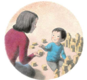
施設イメージイラスト 絵:おかだちあき