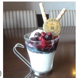
二銭銅貨ミニパフェ(イメージ)