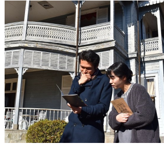
村内での取材風景(イメージ)