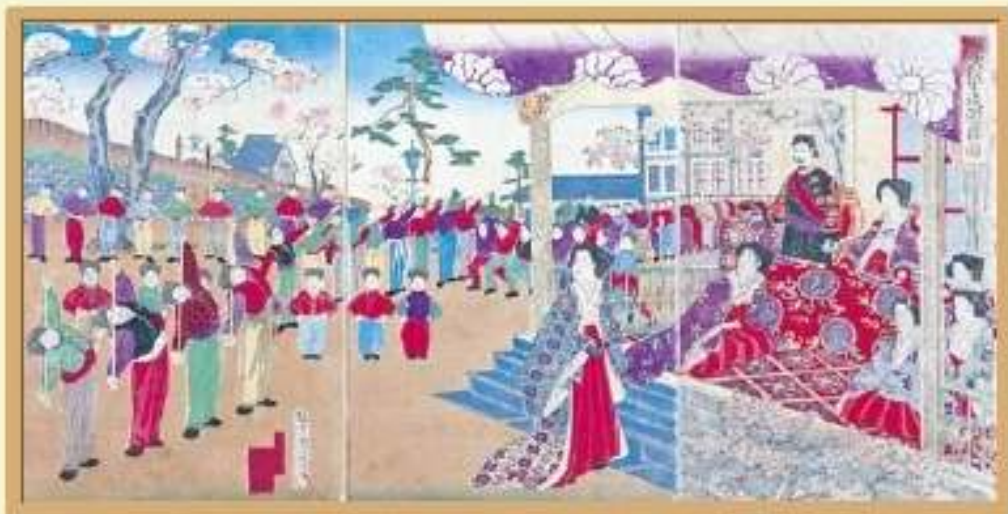
「学校生徒体操之図」 楊州周延 画