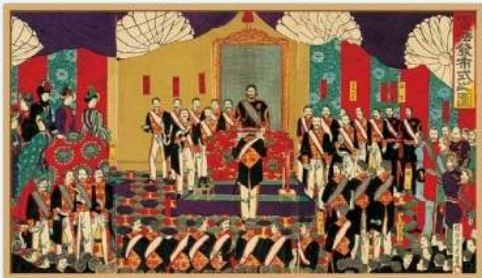
1889(明治22)年2月11日に 行われた憲法発布式の様子 「憲法発布式之図」楊州州延 画